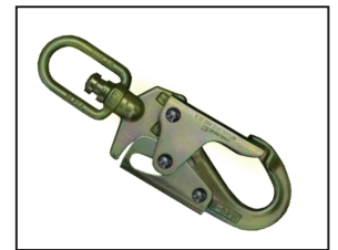
IKV 33 (ANSI Z.359.1-2007; CSA Z259.12-2011) mit Fallanzeiger